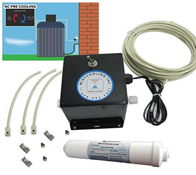
Mistcooling AC Pre-Cool Kit