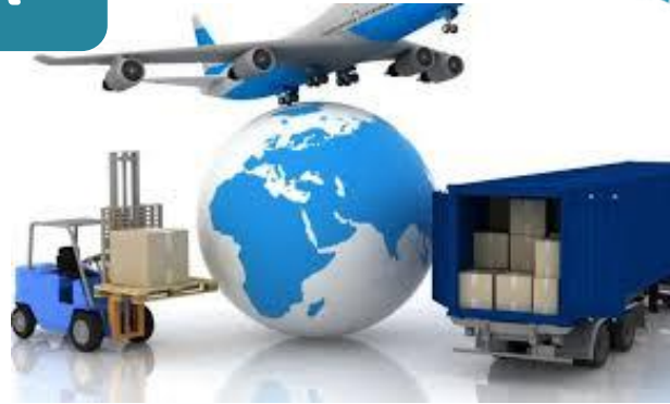
فروش و بازرگانی