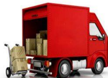
شرکت پخش: ۵۰ مورد