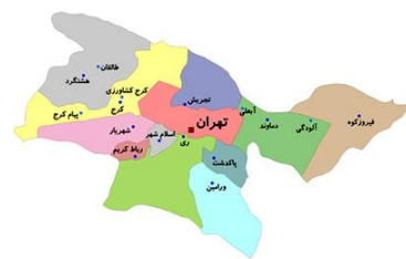
نماینده‌گی استانه‌ها: ۴ مورد