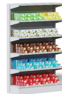
فروشگاه: ۷۰۰ مورد