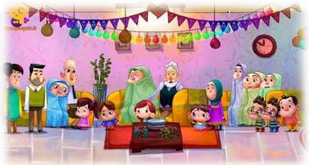
۱. ساختمان گلها