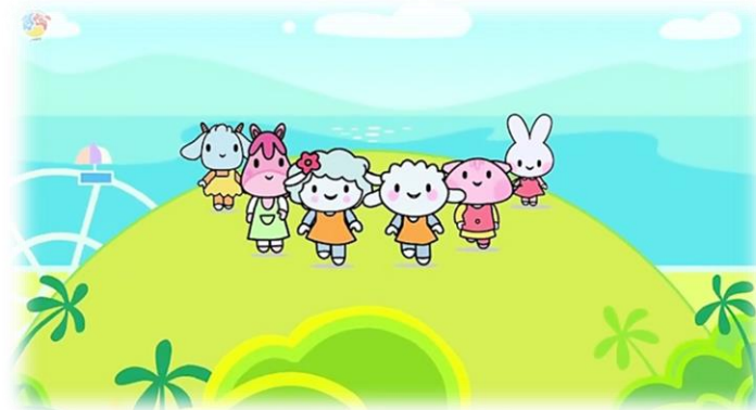
۲. بیعی و بیعو