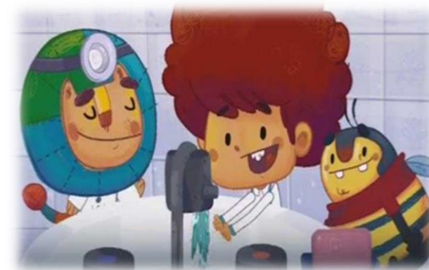
۳. انیمیشن چیا