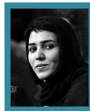
مونا شاهی نویسنده و کارگردان