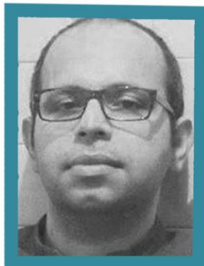
حجت اعظم پور کارگردان هنری