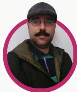
مجید محمودی کارگردان و نویسنده