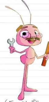
بابا گلیو (آقای تعمیرکار)