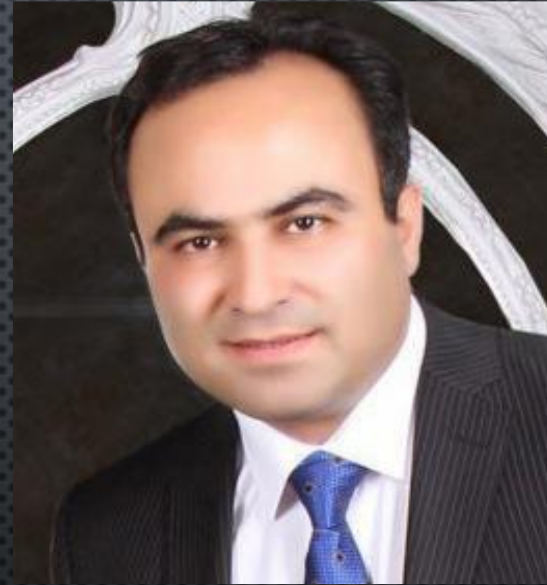
بهرنگ بیطرف بنیان گذار